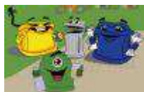
Recicla en colores

Juego didáctico que pretende concienciar sobre la importancia y necesidad de reciclar, dirigido a alumnado de Educación Primaria y Educación Secundaria Obligatoria. Formato CD