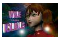
Viaje a Iqualis

Juego didáctico que pretende concienciar sobre la importancia y necesidad de reciclar, dirigido a alumnado de Educación Primaria y Educación Secundaria Obligatoria. Formato CD